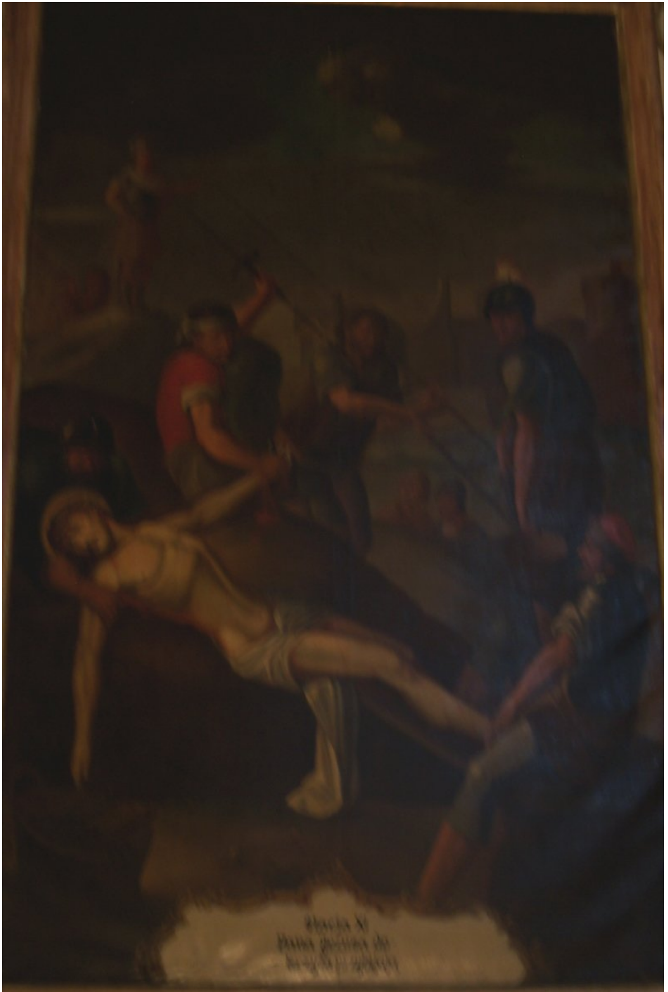
Descida de Jesús desde la cruz por San Juan Evangelista