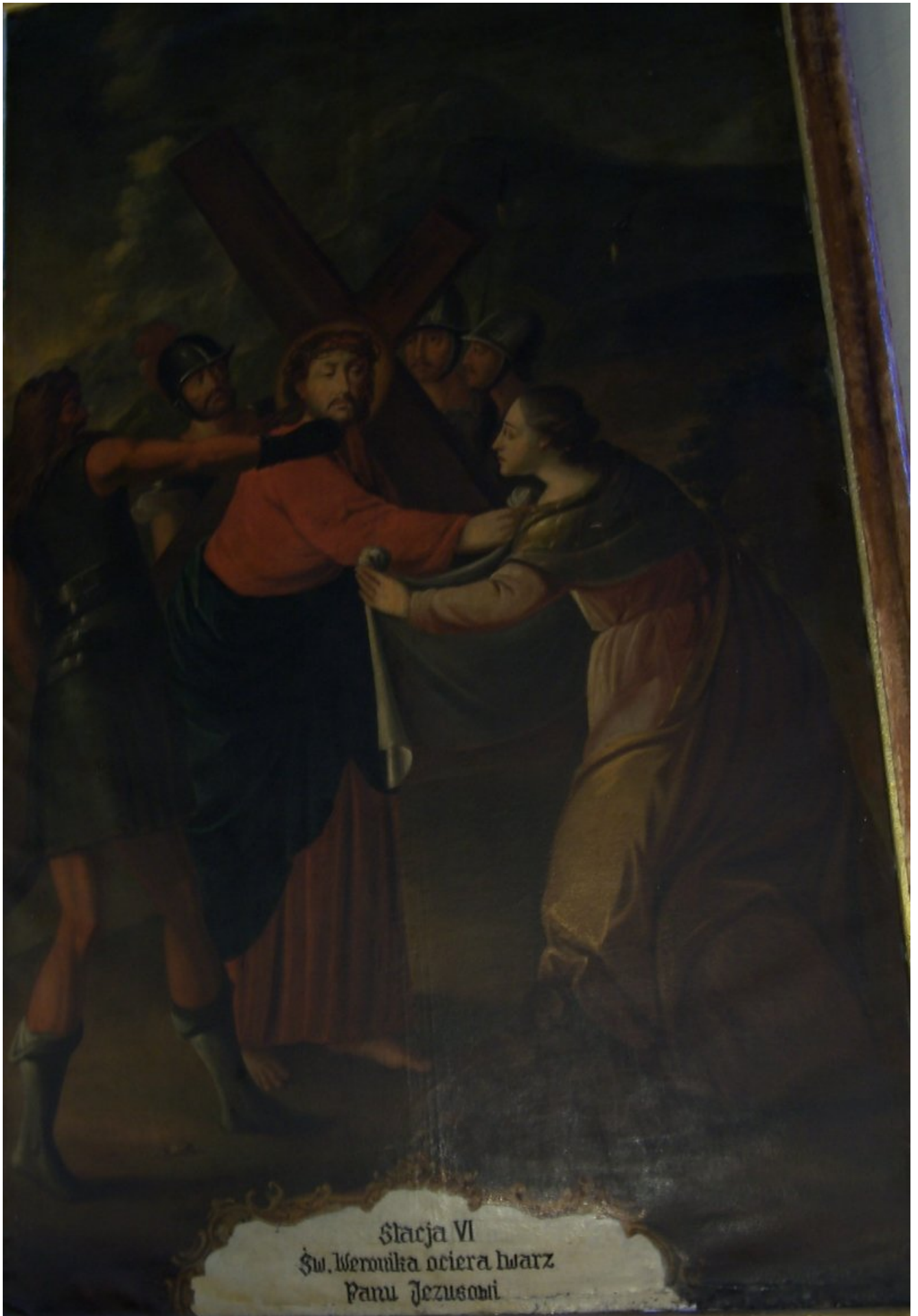
Stacja VI Św. Weronika ociera łwarz Panu Jezusowi