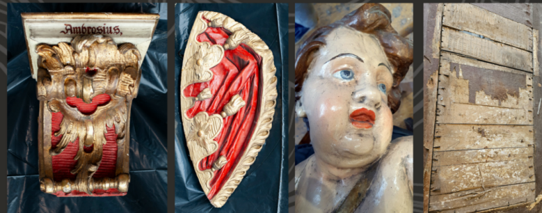
Powyżej fotografie dokumentujące stan zachowania elementów ołtarza - widoczne grube warstwy przemalowań olejnych z wtórnymi złoceniami wykonanymi imitacją złota. Przemalowania w całości miały ahistoryczny charakter, całkowicie zniekształcający formę rzeźbiarską. Drewno w wielu miejscach było mocno spękane i poważnie uszkodzone-największe zniszczenia obejmowały dolne partie ołtarza.