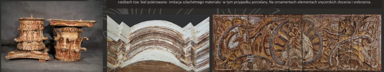
W trakcie prac konserwatorskich - po usunięciu przemalowań, reperacjach stolarskich, uzupełnieniu ubytków drewna, zapraw - w trakcie uzupełniania ubytków złoceń