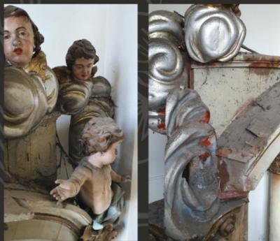
Fotografie stanu zachowania elementów ołtarza - widoczne grube warstwy przemalowań olejnych, zakrywających oryginalne XVIII w. opracowanie.