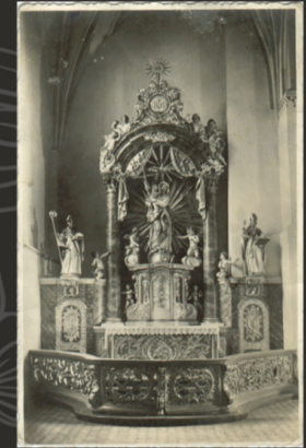
Powijęj fotografie ołtarza przed konserwacją restauracja- stan z 2023 roku. Cała powierzchnia była kilkakrotnie przemalowana olejno. Złocenia i srebrzenia pokryto imitacją złota. Obok archiwalne fotografie. Na pierwszej z nich widoczna aranżacja z 1857. Kolejne zdjęcie to stan z okresu międzywojennego, z wymienioną figurą NMP, zachowaną po dziś dzień. Oryginalne balaski pocięto i wykorzystano wtórnie w kaplicach bocznych.