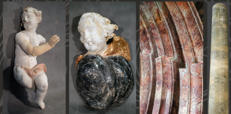
Elementy ołtarza w trakcie prac konserwatorskich- po wzmocnieniu struktury drewna, usunięciu przemalowań olejnych, odsłonięciu oryginalnie zachowanego opracowania z I połowy XVIII wieku, uzupełnieniu ubytków zapraw. Na architekturze jest to malowana imitacja marmuru- tzw. marmoryzacja (czerwona i zielono- błękitna). Na rzeźbach tzw. biel polerowana- imitacja szlachetnego materiału- w tym przypadku porcelany. Na ornamentach-elementach snycerskich złocenia i srebrzenia.