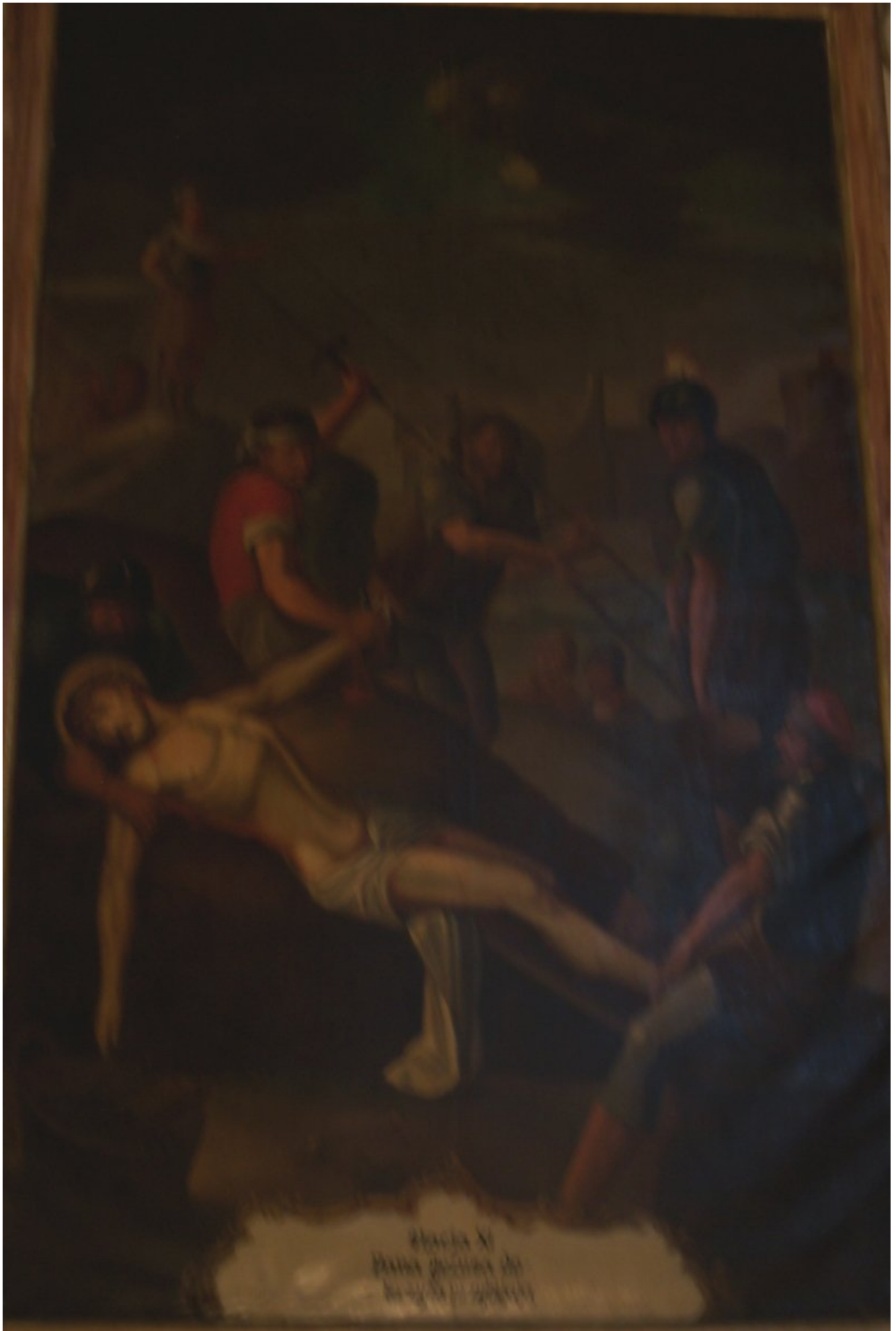
Descida de Jesus do Cruz