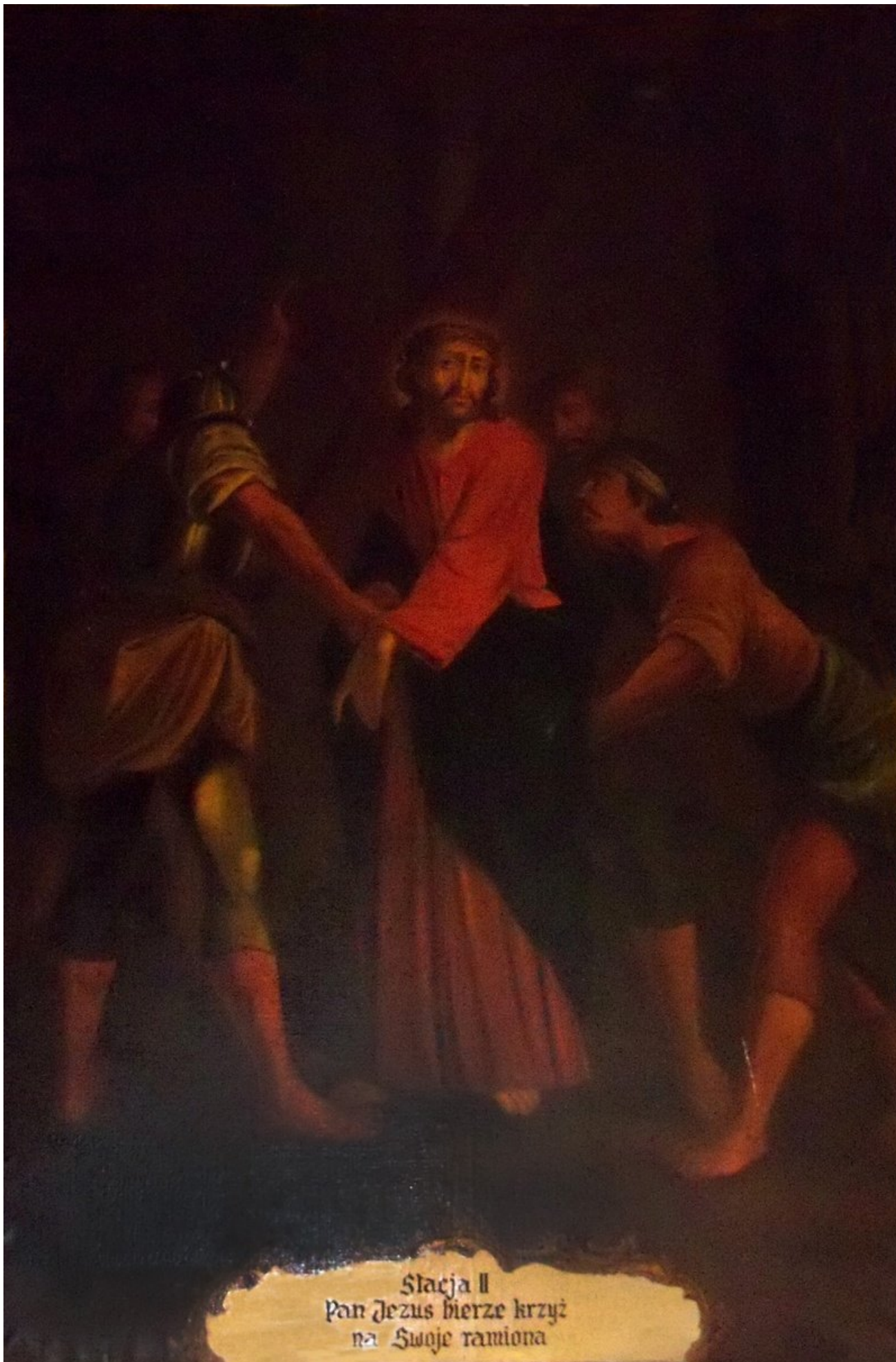
Stacja II Pan Jezus bierze krzyż na Swoje ramiona