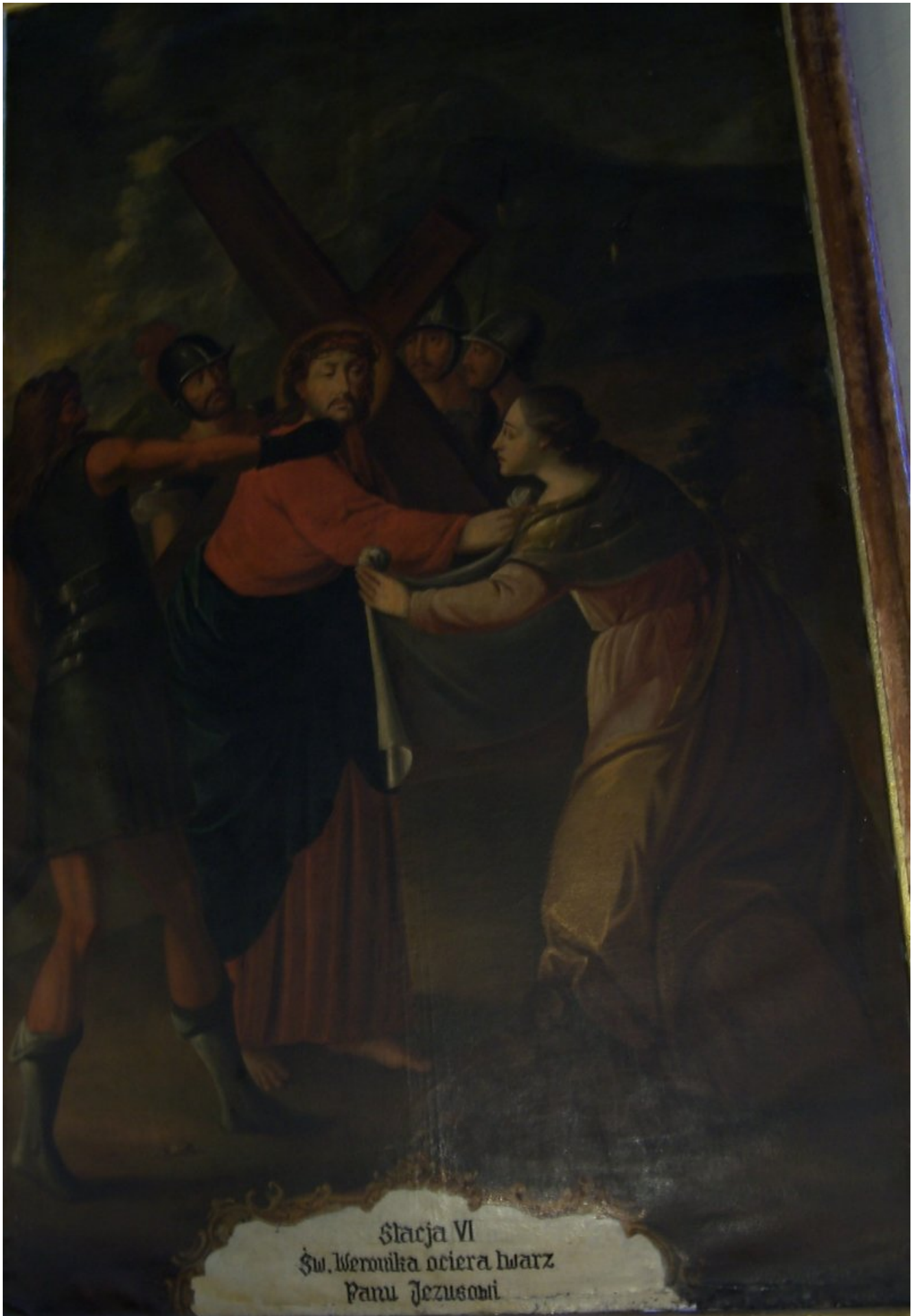
Stacja VI Św. Weronika ociera twarz Panu Jezusowi