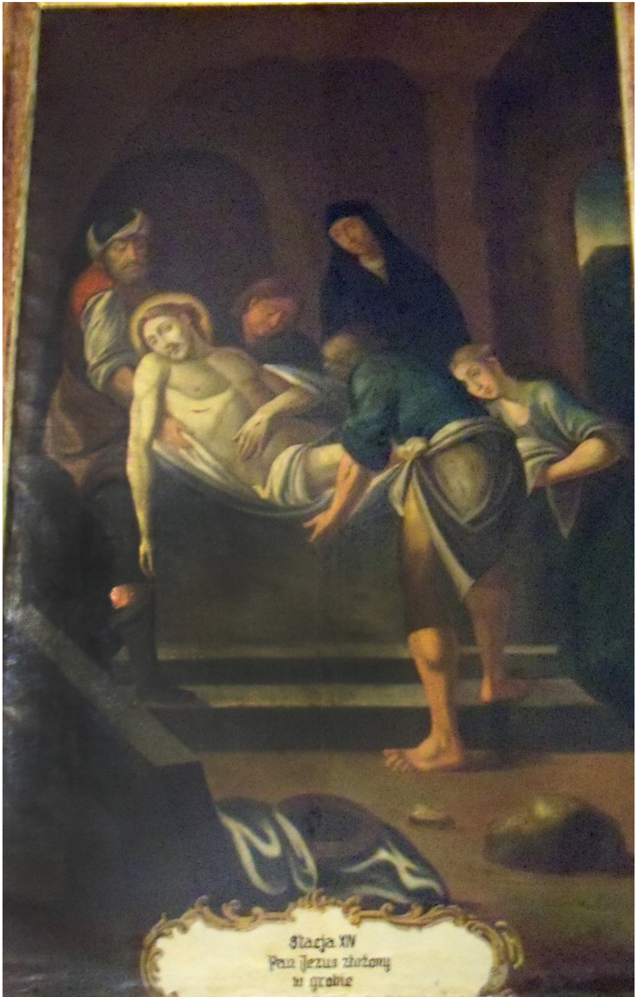
Stacja XIV Pani Jezus złożony w grobie