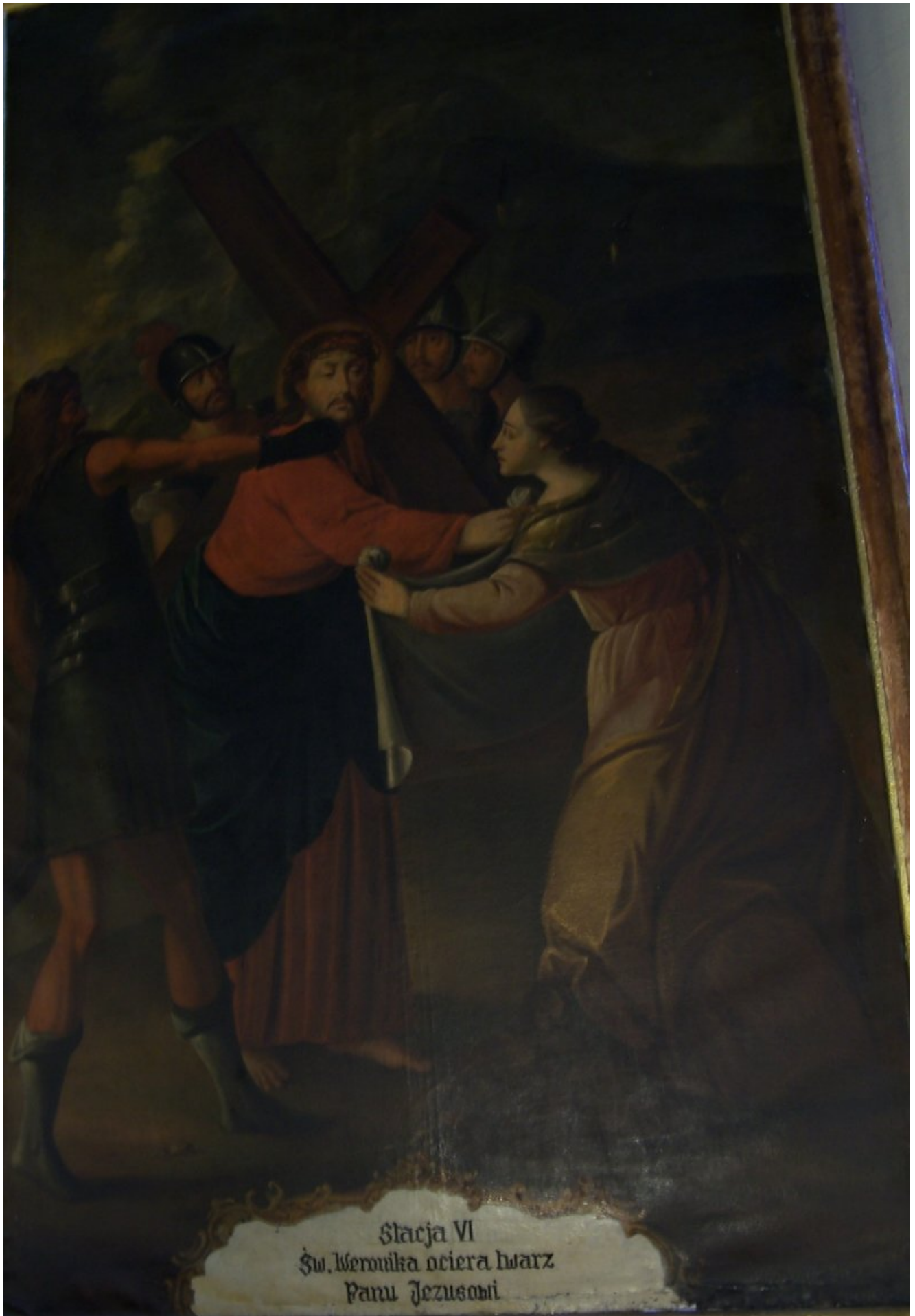
Stacja VI Św. Weronika ociera twarz Panu Jezusowi