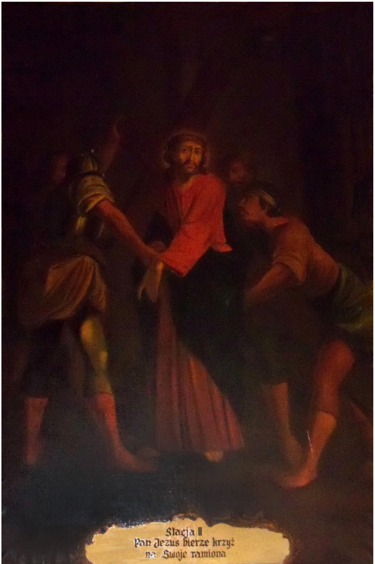
Stacja II Pan Jezus bierze krzyż na Swoje ramiona