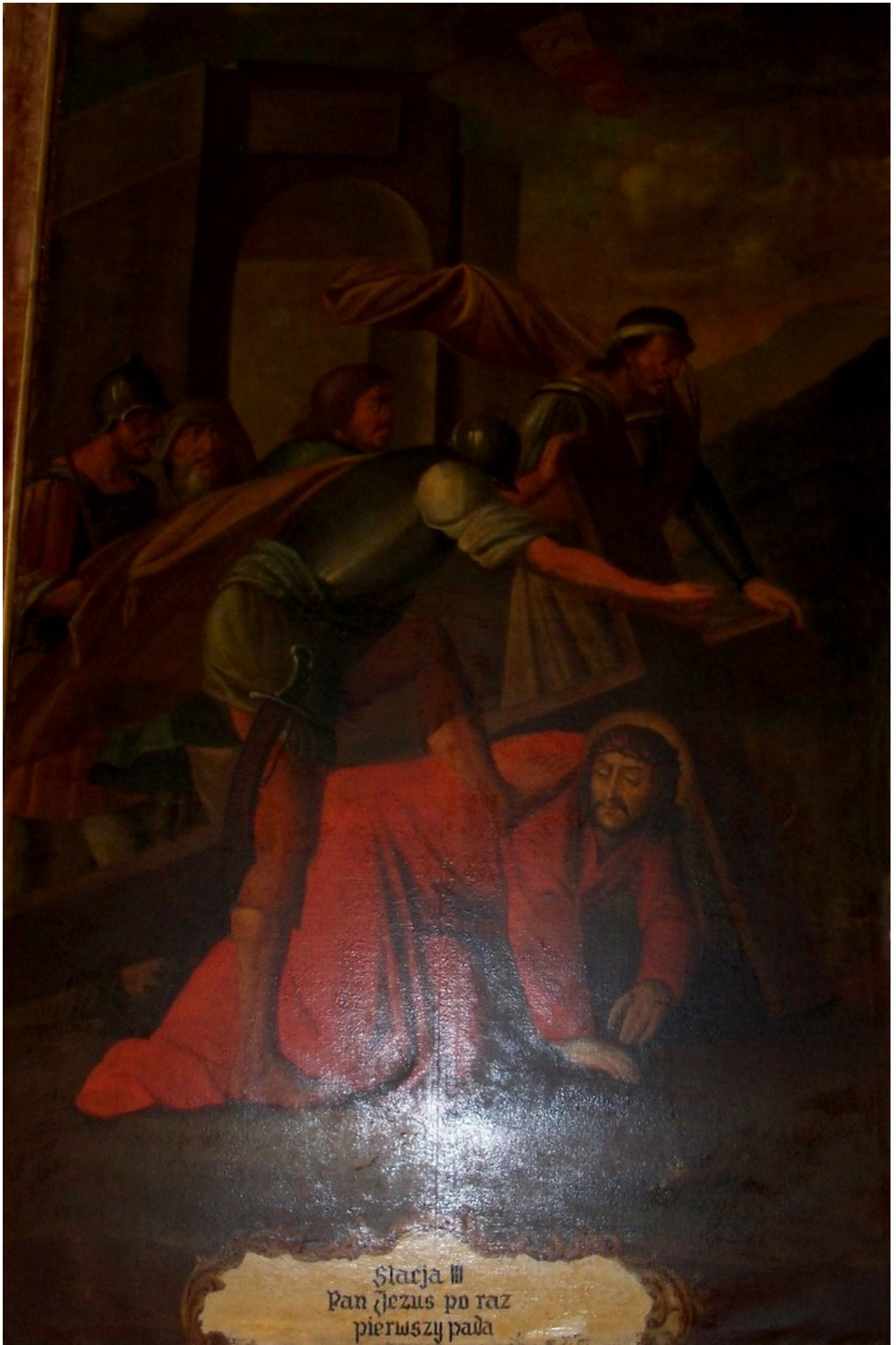
Stacja III Pan Jezus po raz pierwszy pada