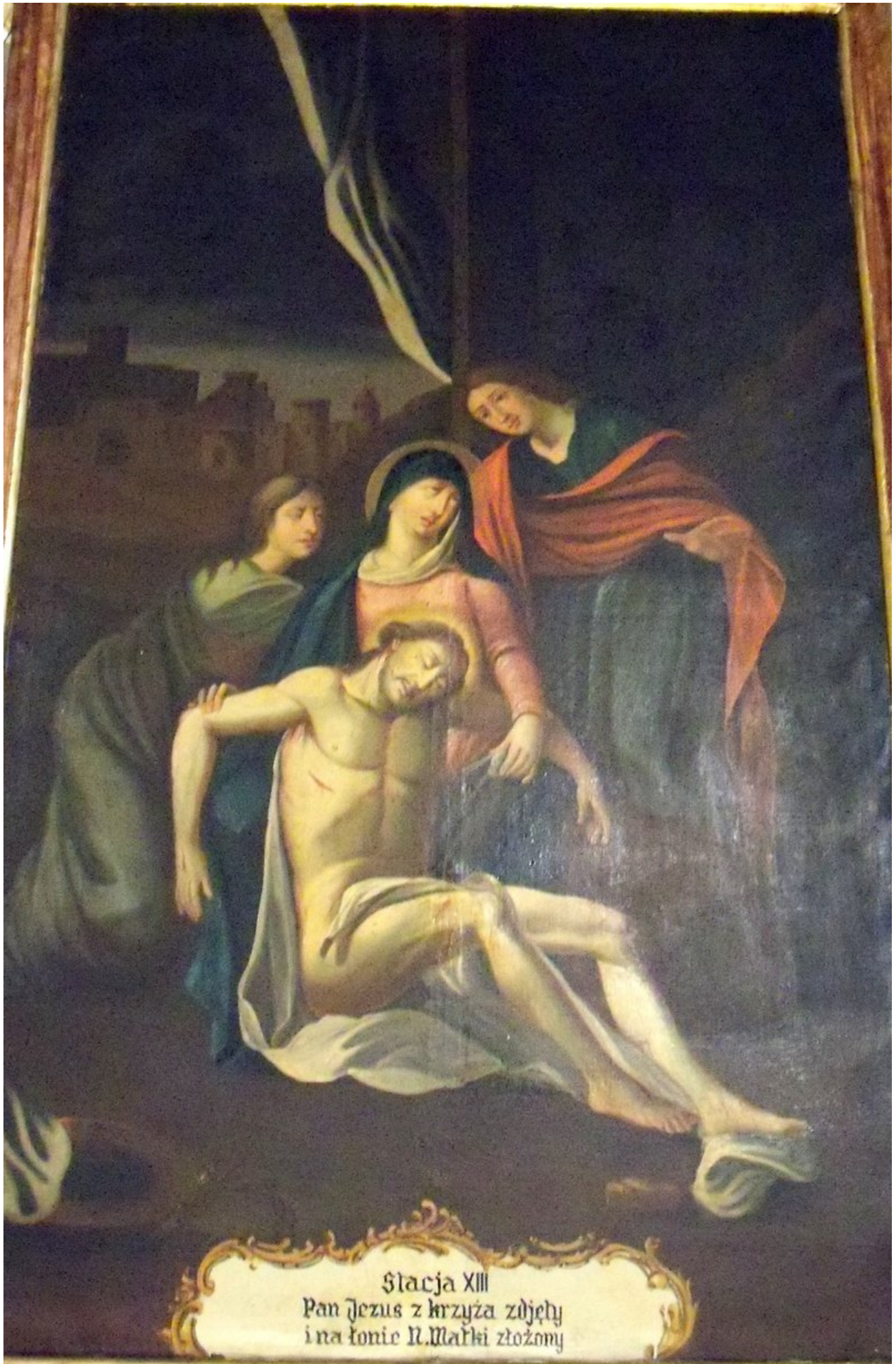
Stacja XIII Pan Jezus z krzyża zdjęty i na łonie R. Matki złożony