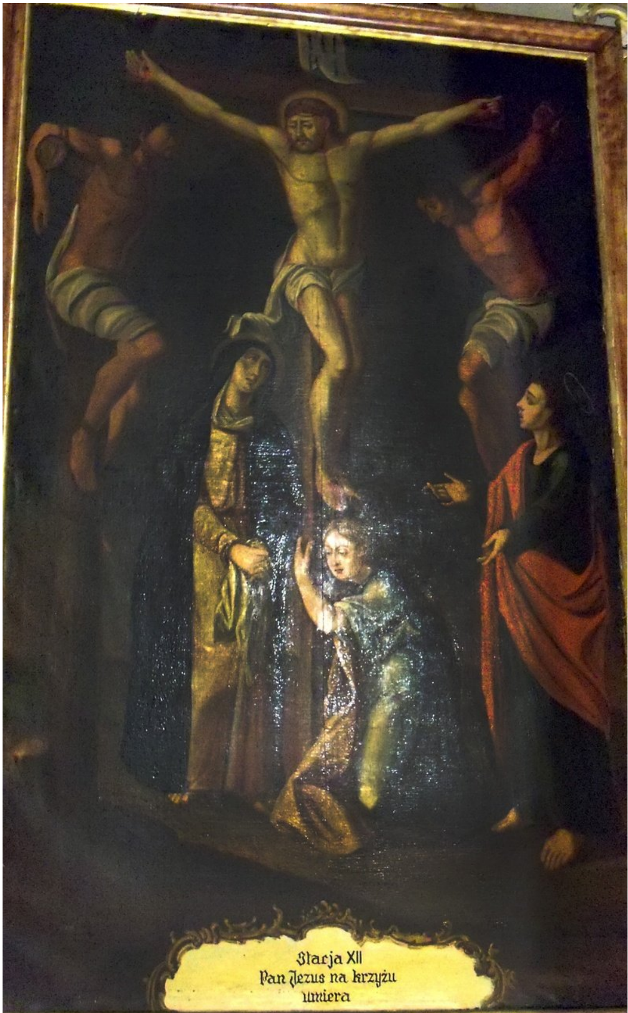
Stacja XII Pan Jezus na krzyżu umiera