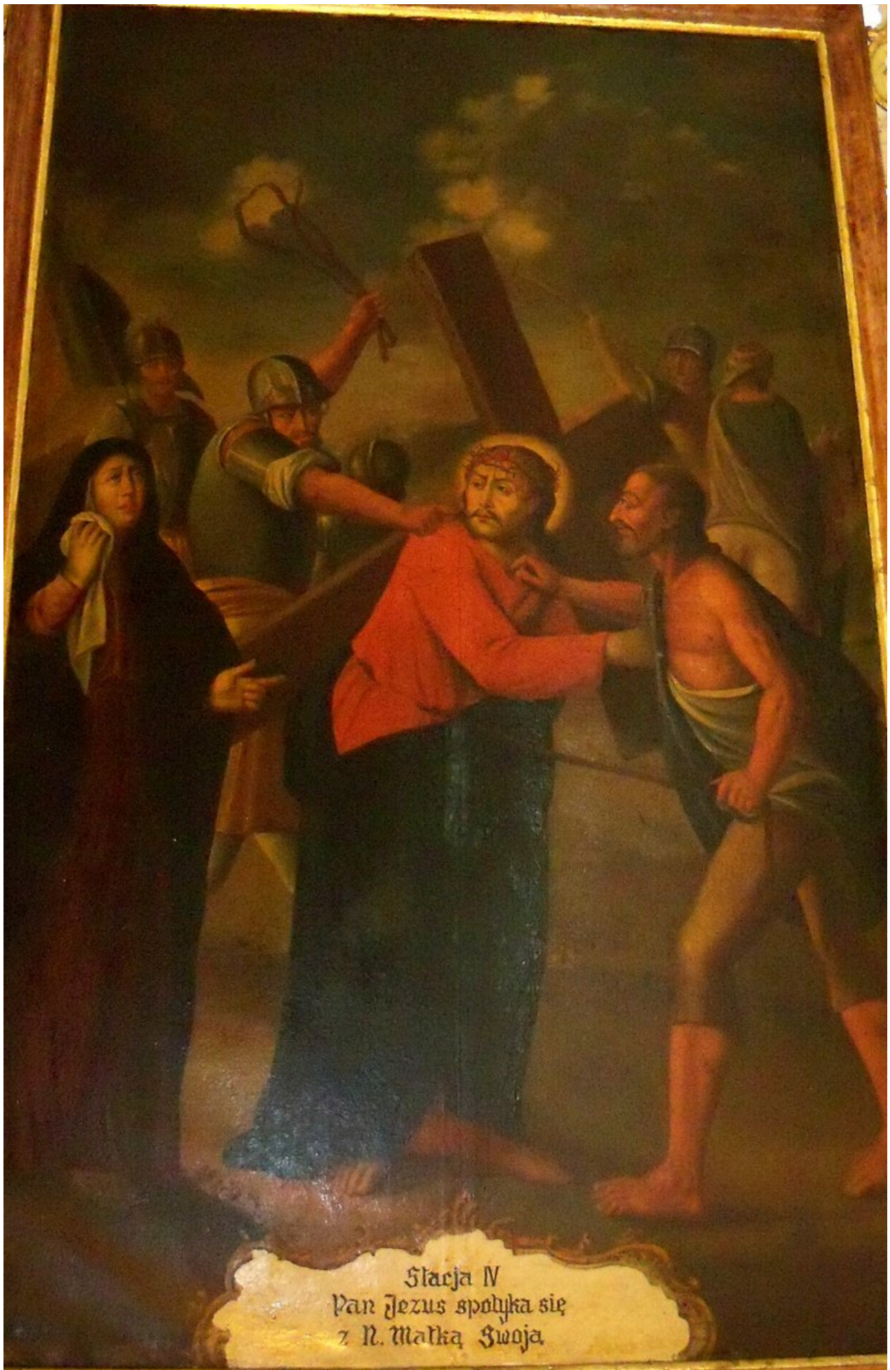
Stacja IV Pan Jezus spolyka się z N. Matką Swoją