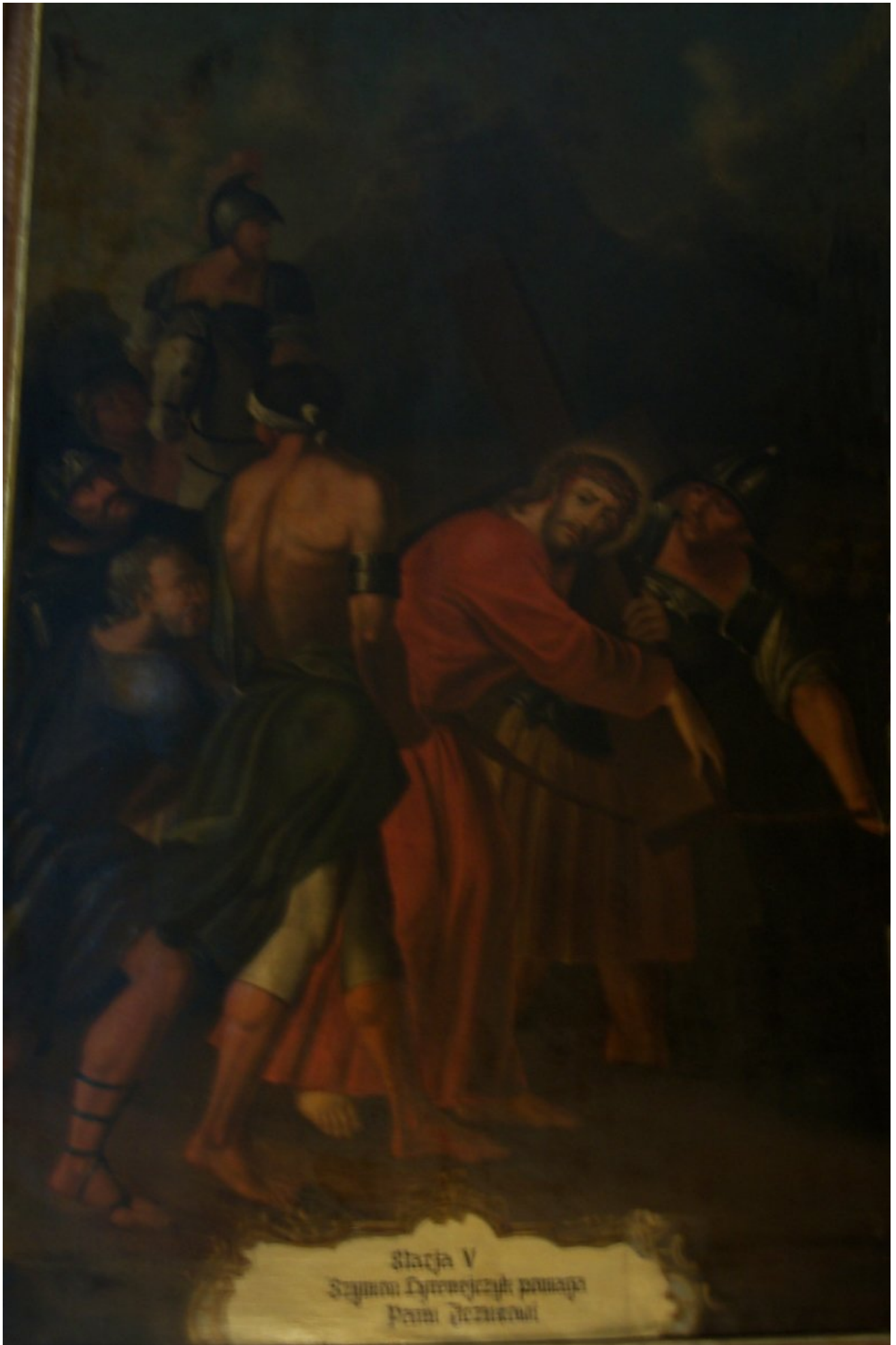
Starja V Szynon Dyronejczyk pomaga Przed Jezusowi