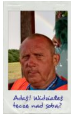
Adas! Widziałeś tęczę nad sobą?