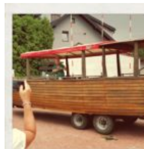
Arka wplynęła w samą porę :)