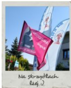
Na skrzydłach łej :)