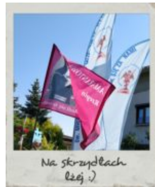
Na skrzydłach łeij :)