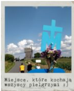
Miejsce, które kochają wszyscy pielgrzymi :)