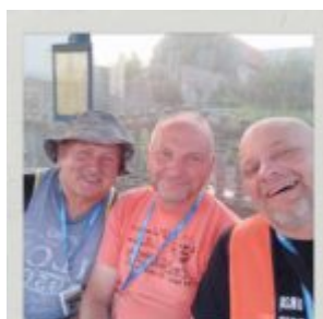
Osmego dnia o poranku na przystanku :)