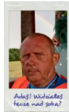
Adas! Widziałeś łecze nad sobą?