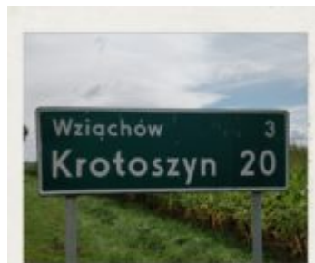
Inspekcja po dwóch latach.