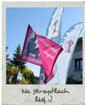
Na skrzydłach łęcz :)