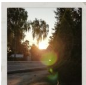
My, którzy wszystko liczymy...