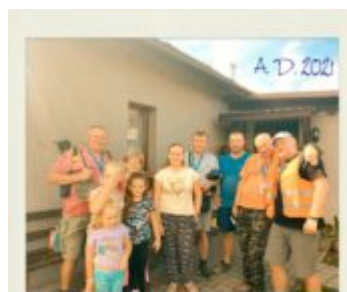
Kramolicom się nie odmawia :)