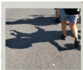
Teraz to już same idą...