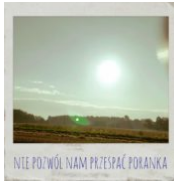
NIE POZWÓL NAM PRZESPAĆ PORANKA