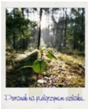
Poranek na pielgrzymim szlaku