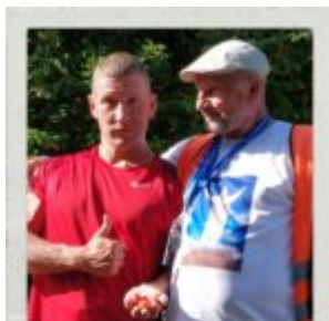
(jest dolrze, ale nie najgorzej jest :)