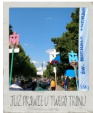
JUZ PRAWIE U TWEGO TRONU