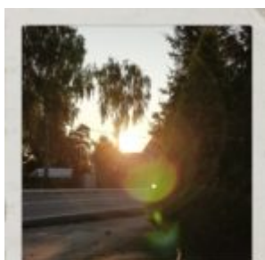
My, którzy wszystko liczymy...