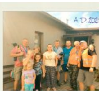
Kramolicom się nie odmawia :)