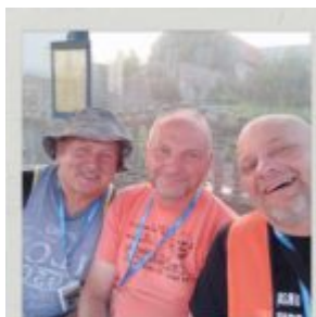
Osmego dnia o poranku na przystanku :)