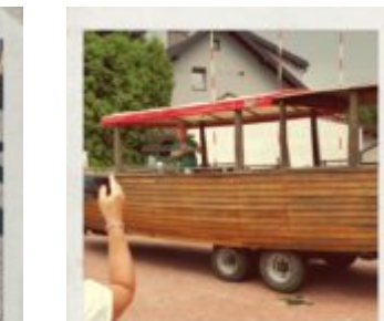
Arka wplynęła w samą porę :)