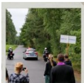
Na bogato! A o :)