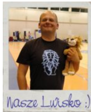
Nasze Lwisko :)