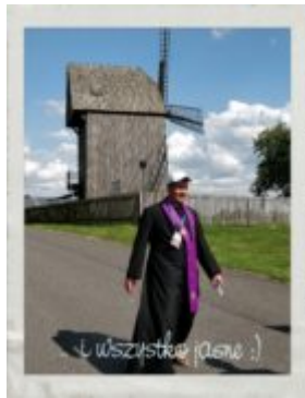
Wszystkie jasno :)