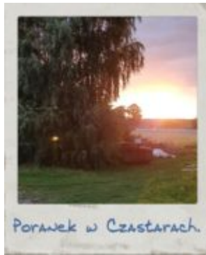
Poranek w Czastarach