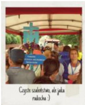
Czyste szaleństwo, ale jaka radocha :)