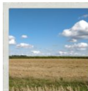
w cichym powieściu.