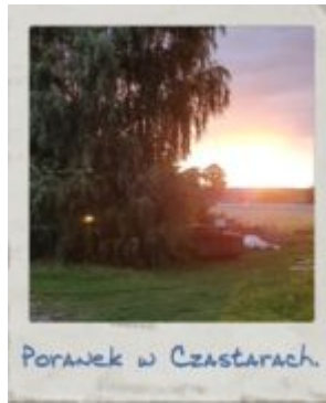
Poranek w Czastarach