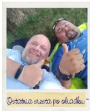
Ostatnia suesta po obiadku :)