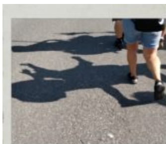
Teraz to już same idą...