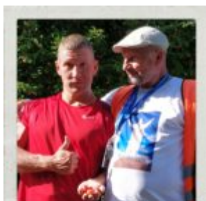
(jest dolrze, ale nie najgorzej jest :)