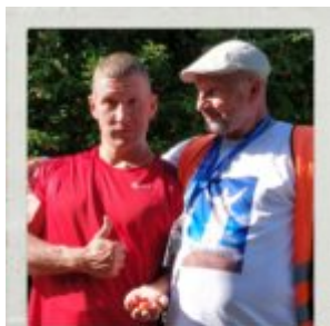
(jest dolrze, ale nie najgorzej jest :)