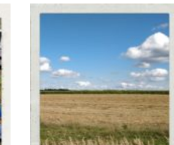
w cichym powieściu.