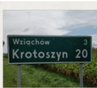
Inspekcja po dwóch latach.