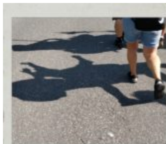
Teraz to już same idą...