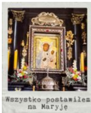
Wszystko postawiłem na Maryję