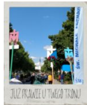
JUZ PRAWIE U TWEGO TRONU