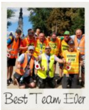
Best Team Ever