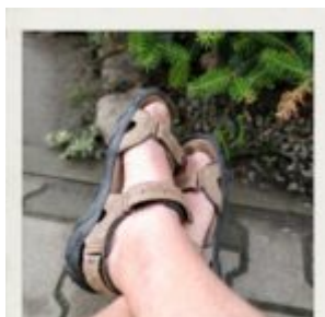
Dnia siódmego, ciąż dajemy radę.